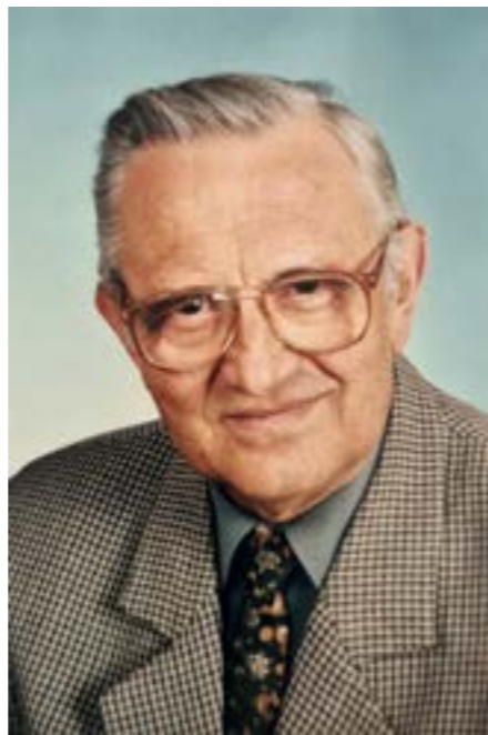
Професор Юрій Бача.

25 січня 2021 року, на 89 році життя, відійшла у вічність одна з найактивніших особистостей Пряхівщини, професор Юрій Бача. Науковець, літературознавець, публіцист, громадський і культурно-суспільний діяч Юрій Бача був засновником і активним членом Ради Українського клубу в Пряшеві в «Руському домі», співпрацював з молодіжним ансамблем «Весна» (1965-1971), з українським хором «Ластівка» в Кошицях. Юрій Бача був засновником і головою Ради української молоді в роках 1969-1970. Діяльність згадуваних колективів та українського клубу під час так зв. «нормалізації» були заборонені. Був головою підготовчого комітету Координаційної ради українців Пряхівщини, члена Європейського конгресу українців, з яким в роках 1966-2009 співпрацював. Співпрацював і з молодіжною організацією ПЛАСТ в роках 1991-2008, з Українським народним хором «Карпати» в Кошицях. Юрій Бача є автором монографій «Літературний рух на Закарпатті середини 19 ст.» (Пряхів, 1961), «З історії української літератури Закарпаття та Чехословаччини» (Пряхів, 1998), збірки оповідань «Аматері твоєї завиджу» (Пряхів, 1991), роману «Олекса», (Київ, 1993), публіцистична студія «Добрий день, Україно» (Пряхів, 2002), «Вибрані твори», «Мистецька лінія» (Ужгород 2006, 2008) та дальших. В 60-х роках його публікації визначалися гострою правдивою критикою й аргументацією, що не було по смаку ані державному, ані партійному керівництву. Статтю «Здраствуй Україно»