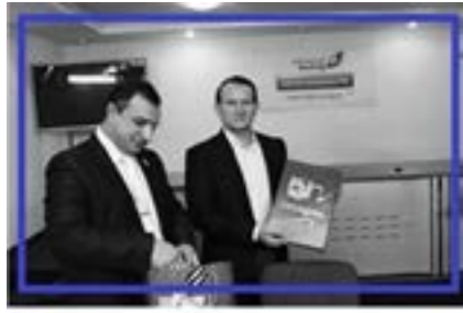
Нові фігури на дошці. Коли і для чого Віктор Медведчук став головним представником "руського мира" в Україні