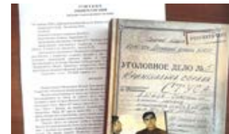
Рішення Дарницького суду про заборону книги Кіпіані про Стуса, та обкладинка книги.