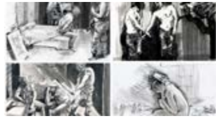
Малюнки художника Сергія Захарова із концтабору «Ізоляція».