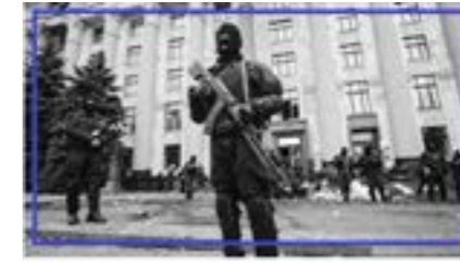
Політична воля та ризик. Як Україна втримала Одесу, Дніпро та Харків і чому втратила Донбас