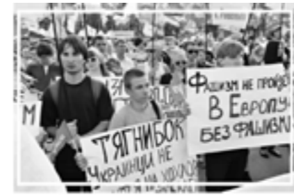
Потрапили в капкан. Як рішення про рух України до ЄС розкололо Партію регіонів та вдарило по її електоральних позиціях і хто зміг цим скористатися