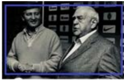
Референдум про регіональну самостійність Донбасу у 1994 році. Як Єфим Звягільський шантажував Леоніда Кучму та став вице-прем'єром

Головою міськради (за тодішніми правилами – мером) став мало кому відомий завідувач кафедри Донецького політехнічного інституту Олександр Махмудов. З усіх донецьких мерів цей, мабуть, був найнетиповішим. М'який, інтелігентний Махмудов явно не впливався в той образ «типового донецького», який сьогодні є закорінним у масовій свідомості. Не відповідав він і типу радянського керівника – «міцного господарника», яких у народі люблять і досі. Втім, протримався Махмудов на чолі міста зовсім недовго. Управлінського досвіду у нього не було, а період мерства випав на найважчий час. Економіка СРСР вмирала, гроші стрімко знецінювалися, місту загрожували перебої з продуктами. Уже в 1991 році Махмудова було відправлено у відставку рішенням сесії міської ради, і він більше вже не зміг повернутися в політику. У 2005 році він загинув в автомобільній аварії. Близько року в Донецьку панувало беззладдя. Розпад СРСР місто фактично пережило без керівника. А у листопаді 1992 року до влади в столиці Донбасу знову повернулися «господарники». У мерське крісло всівся той, кого потім назвали «хрещеним батьком донецьких» – авторитарний керівник радянського типу, директор шахти імені Засядька Юхим Звягільський. Із цього і почалась історія сходження до влади кримінально-політичних кланів