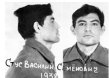
В'язничне фото Василя Стуса, 1972 рік.

адвокат Медведчук тоді не читав і не міг читати — їх після 1966 року у Радянському Союзі не публікували. Єдину на той момент збірку «Зимові дерева», без згоди автора, надрукували 1970 року за кордоном. На палітурці було вказано, що це зробило брюссельське видавництво «Література і мистецтво», а насправді книжка побачила світ у Лондоні, у «бандерівському» видавництві. Уперше долі Медведчука та Стуса перетнулися, ймовірно, влітку 1980 року, коли Віктор Володимирович працював пересічним київським адвокатом, а Василь Семенович перебував у камері слідчого ізолятора КГБ на вулиці Володимирській. Чотирнадцятого травня 1980 року Стус був заарештований співробітниками слідчого відділу Управління КГБ по м. Києву та Київській області за звинуваченням в «антирадянській агітації та пропаганді». Прощаючись з дружиною Валентиною, Стус сказав, що не братиме участі в попередньому слідстві й суді, відмовляється від адвоката (! — В. К.), не звертатиметься до вищих касаційних інстанцій, погодиться свідчити лише за умови відкритого судового процесу та участі міжнародних правозахисних інституцій, включно зі Світовим конгресом вільних українців. Стусові інкримінували написання листів до Андрія Сахарова, Петра Григоренка,