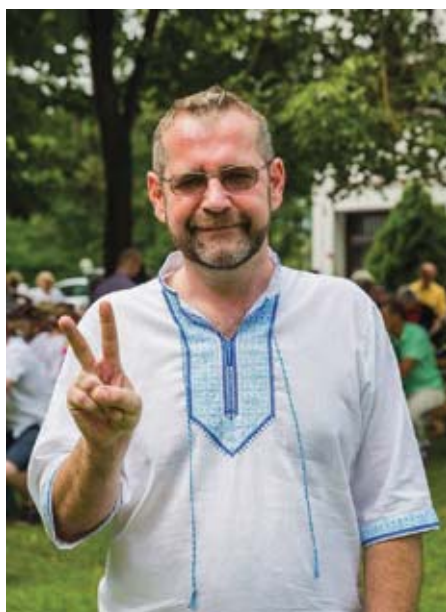
Австрієць Міхаель Мозер на промовистому фото.

Коли очевидці переповідають цю подію, то здебільшого акцентують не на фактах, а на постатях. Відзначають ввічливого професора, який говорив розумні речі, й каверзну «диверсантку», яка кричала, що має «собачий язык». Щоб у надмірних емоціях-гаслах не втратити сенсу, спробую констатувати, які ж то «розумні речі» звів у Празі 25 січня 2017 року Міхаель Мозер – президент Міжнародної Асоціації Україністів і професор мовознавства Інституту славістики Віденського університету.