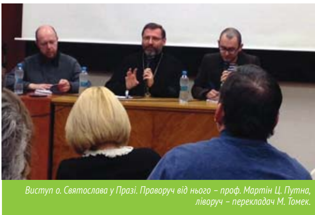
Виступ о. Святослава у Празі. Праворуч від нього – проф. Мартін Ц. Путна, ліворуч – перекладач М. Томек.

Як же добре, коли священик говорить так, що його хочеться почути! Не одній мені було так добре вечірнього 8 березня 2017 року: у величезній аудиторії філософського факультету Карлового університету лаголив очільник Української Греко-Католицької Церкви Святослав Шевчук.