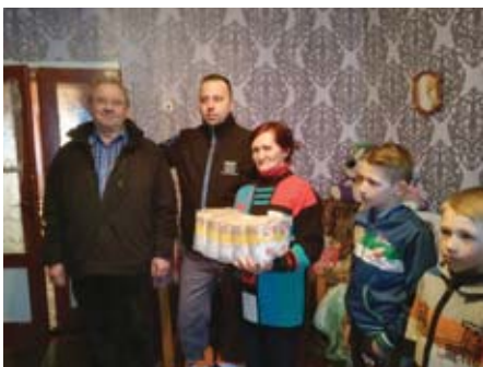
Роздавання чеської приватної допомоги у Воловецькому районі на Закарпатті.