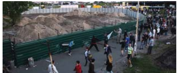
Битва на Осокорках із забудовником: дати місцевим час – і вони самі розсваряться і розбіжаться, і на місці скверу виникне черговий «торгово-розважальний центр».

Якось їдучи автівкою з Польщі до України,