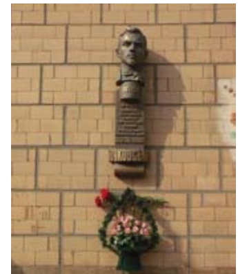
Меморіальна дошка у містечку Долинська в самому центрі України — між Кропивницьким та Кривим Рогом.