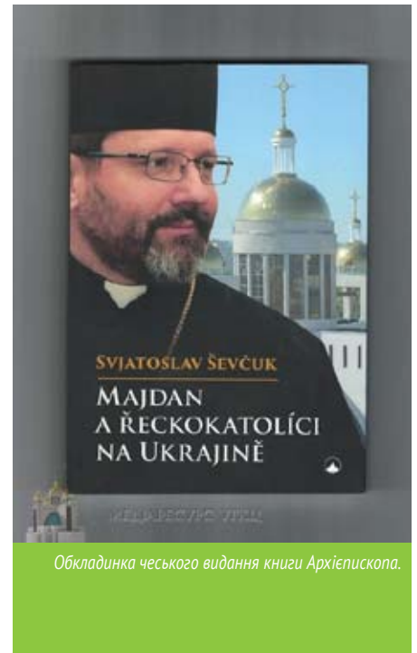
Обкладинка чеського видання книги Архієпископа.

вона стане маргіналізованою» – ствердив Святослав Шевчук, відповідаючи на запитання про межі ангажування УГКЦ в суспільне життя. Він також зазначив, що греко-католицька церква добряче приклалася до формування нового європейського українця, ставши каталізатором трансформації громадянського суспільства. УГКЦ заснувала Український католицький університет. «УГКЦ ніколи не підтримувала й не створювала жодної політичної партії, – запевнив єпископ. – Ніколи не агітувала людей голосувати за політиків, жодної політичної пропаганди!» Він наголосив також, що з усіх інституцій в Україні найбільший відсоток