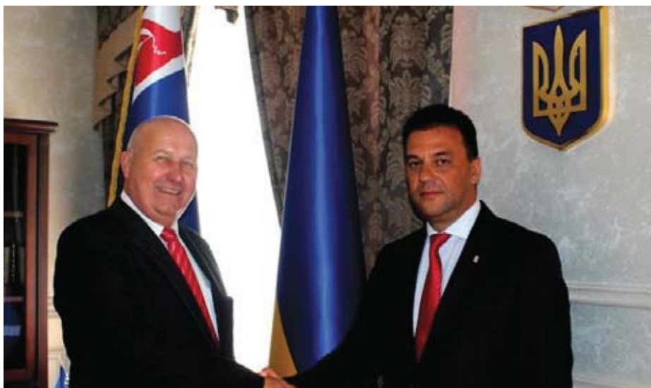
О. Бубенічек та М. Рівіс після домовлення про співпрацю регіонів.

Закарпаття розпочинає співпрацю з Устецьким краєм. Її мета – технічна допомога навчальним та соціально-культурним закладам. Відповідний проект угоди готовий до схвалення депутатами регіонів. Під час візиту на Закарпаття делегації Устецького краю, очолюваної гетьманом краю Олдржіхом Бубенічком, 21-24 серпня 2016 року, із головою Закарпатської обласної ради Михайлом Рівісом було домовлено про встановлення партнерських відносин між двома регіонами. Закарпатці до Усті-над-Лабем навідувалися 4-5 травня 2016 року. Регіони співпрацюватимуть у таких галузях, як економіка, загальна та професійна освіта, науково-технічна сфера, захист навколишнього середовища, культурна та природна спадщина, туризм, розвиток сіл і міст, культурне, громадське та спортивне життя. Також передбачена співпраця між місцевими органами влади та установами сільського господарства, використання міжнародних структурних фондів та інших фінансових інституцій, що підтримують розвиток. Цим угода сприятиме виконанню Програми економічного і соціального розвитку Закарпатської області на 2017 та 2018 роки, повідомляє прес-служба Закарпатської облради. Це третій чеський регіон, з яким Закар-