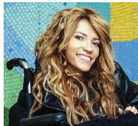
Юлія Самойлова Києва не побачить.

22 березня 2017 року СБУ прийняла рішення про заборону російській співачці Самойлової, яка прикута до інвалідного візка та раніше незаконно відвідувала тимчасово окупований Крим, в'їжджати в Україну з метою участі у конкурсі. ЕБУ запропонували транслювати її виступ по відеозв'язку, проте влада держави-агресора Росії відмовилася від цієї ідеї. Сама співачка сподівається, що «все ще зміниться». Керівництво «Євробачення» спочатку говорило про повагу до рішення України, але після істерки у російських ЗМІ та тиску російських дипломатів також висловило невдоволення забороною СБУ щодо Самойлової. Дійшло навіть до погроз виключити з конкурсу Україну, якщо «вихід із ситуації не буде знайдений». Однак офіційний Київ поступатися не збирається.