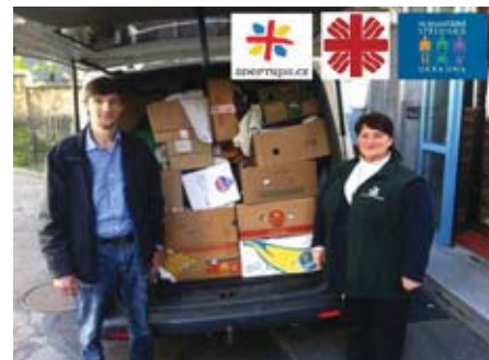
Одна із численних остравських збірок перед вїздом до Тячева.