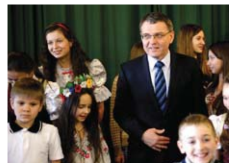
Міністр Л. Заоралек з українськими дітьми