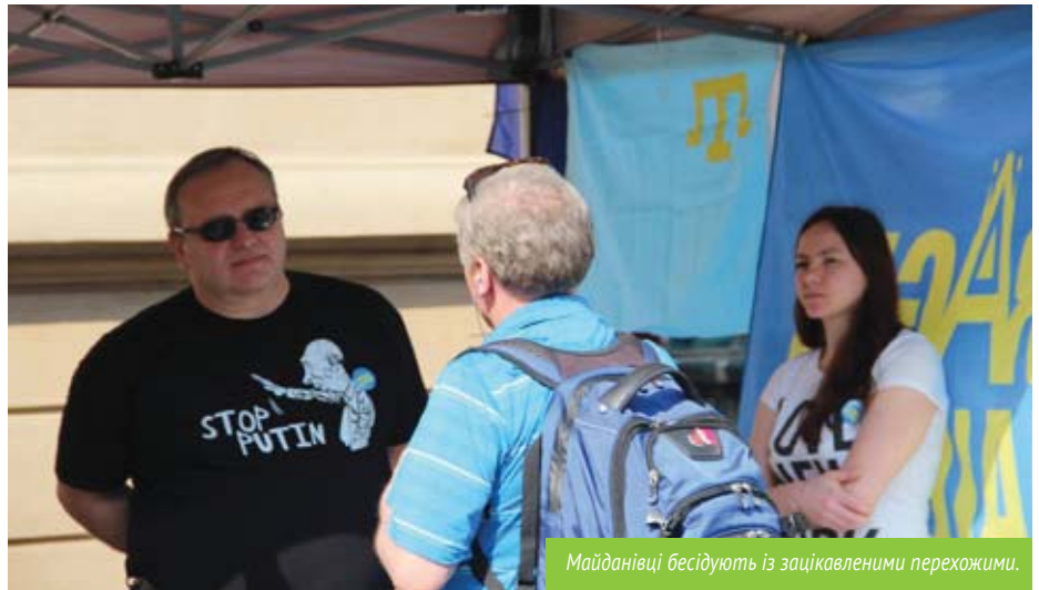
Майданівці бесідуєть із зацікавленими перехожими.

У неділю, 26 березня, майданівці та представники білоруської громади у Чехії висловили взаємну солідарність у зв'язку з нещодавніми масовими арештами борців за