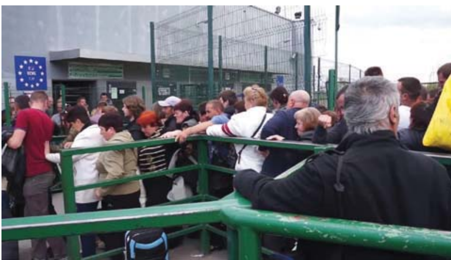
Польсько-український піший перехід Медика-Шегині.

Відтік українців на роботу за кордон посилюється з економічною кризою, ростом тарифів на комунальні послуги та падінням гривні. Цьому сприяє несприятлива ситуація з трудовими ресурсами в сусідніх країнах, які намагаються покращити її за рахунок приїжджих з України.