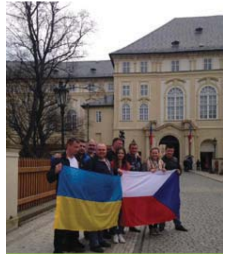
Українські воїни з волонтерами перед Празьким Градом.