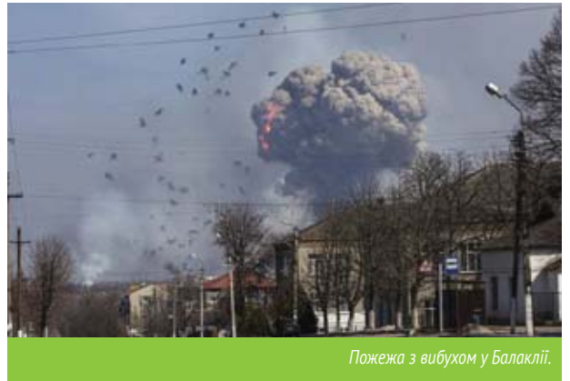
Пожежа з вибухом у Балаклії.

ли сервер і відеореєстратор військової частини. На них зберігається інформація про пропускний режим та людей, які заходили до військової частини. 24 березня пожежу в Балаклії локалізували, однак 20 тисяч жителів навколишніх житлових будинків у радіусі 10 кілометрів тимчасово евакуювали. 1 людина загинула і кілька осіб постраждали унаслідок ланцюгової реакції вибухів. У багатьох домогосподарствах населеного пункту було пошкоджено майно. Війська втратили значну кількість боєприпасів, однак основний та дефіцитний їхній запас перебував у підземних сховищах та не зазнав і не завдав ушкоджень. 5 квітня зону забруднення зменшено до 1 км, рятувальники очистили від вибухонебезпечних предметів територію Ба-