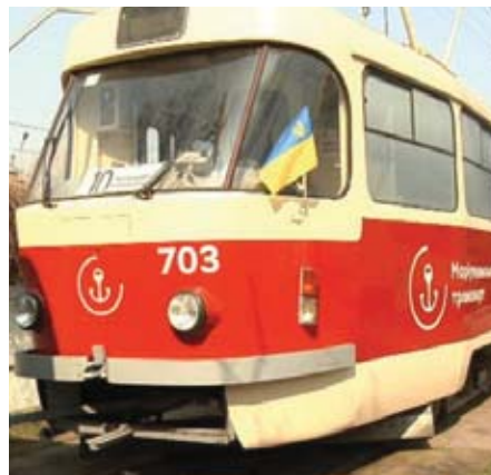
Празькі трамваї на коліях Маріуполя.