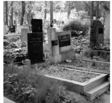
Могила С. Ключурака у Празі.