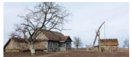
Сваловичі, Волинь. Фото чеського художника-постановника Яна Власака.

Також на Волині наприкінці березня розпочалися зйомки фільму у міжнародній копродукції «Пофарбоване пташеня» за світовим бестселером Єжи Косинського. Режисер фільму Вацлав Маргоул вже знімав у Африці відомий фільм «Тобрук». Цього разу він також взявся за історичну стрічку – про повоєнні часи, у які люди ще не відійшли від жахів побачених масових смертей. Людей все ще переслідують стереотипи, пов'язані з Голокостом та іншими трагедіями. Весь цей біль відобразитиметься на маленькому хлопчику, якому не