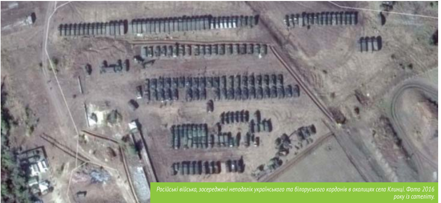
Російські війська, зосереджені неподалік українського та білоруського кордонів в околицях села Клинці. Фото 2016 року із супутнику.

Росія зосередила біля кордону з Україною близько 18 тисяч військовослужбовців і велику кількість військової техніки. Про це 5 квітня заявив перший заступник міністра оборони Іван Руснак під час засідання Міжпарламентської ради Україна-НАТО в Києві. «На території Російської Федерації в безпосередній близькості до кордону України на сьогодні розгорнуті підрозділи російських Збройних сил чисельністю понад 18 000 військовослужбовців, близько 1370 танків і бойових броньованих машин, близько 300 артилерійських систем і систем залпового вогню, близько 700 бойових літаків і вертольотів, 24 бойових кораблів», – розповів він. Руснак зазначив, що у двох гібридних армійських корпусах на Донбасі та регулярних військах у Криму Росія випробовує нові форми і способи ведення бойових дій, новітні зразки озброєння і військової техніки. До кінця 2018 року генеральний