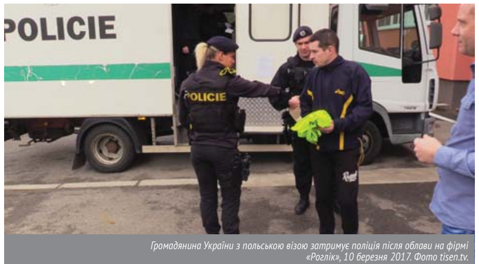
Громадянина України з польською візою затримує поліція після облоги на фірмі «Роглік», 10 березня 2017.

Авторки є експертками з міграційного права migraceonline.cz