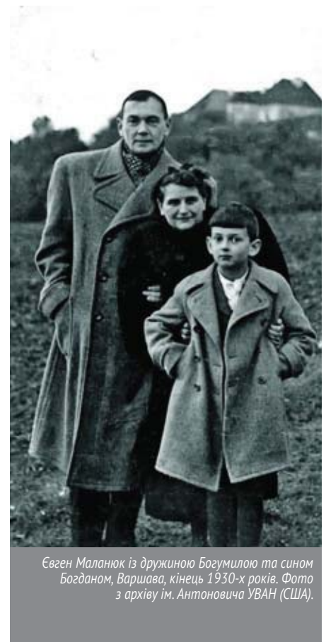
Євген Маланюк із дружиною Богумилою та сином Богданом, Варшава, кінець 1930-х років. Фото з архіву ім. Антоновича УВАН (США).

1919 – потрапив у полон до поляків. Наступний рік провів у таборах для інтернованих – у Штелкові, Шипіорні та Каліші. Пише вірші і бере участь у виданні літературного журналу «Веселка». «Ходив по таборівим подвір'ї у незмінних обмотках, що якось підкреслювали його трохи ци-