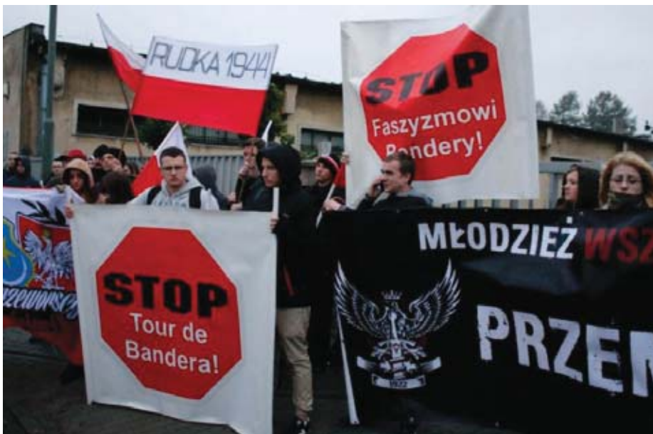
Всі ці транспаранти «проти Бандери», та й самі десятки зібрань десятків польських націоналістів були щедро оплачені Росією руками Усовського.

Останнім часом стосунки України і Польщі почали псуватися. У Польщі вже пройшло кілька антиукраїнських акцій, деякі польські політики знову заговорили про «Волинську різню» й вимагають від України перегляду своєї історії. Водночас в Україні хтось почав руйнувати польські пам'ятники. Здавалося б, непрості питання українсько-польської історії вже давно обговорили на двосторонньому рівні, але хтось знову почав ворухити старе. Водночас в погіршенні відносин між двома країнами не зацікавлена ні Україна, ні Польща. Хто ж стоїть за останніми подіями?