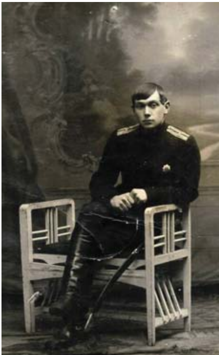
Євген Маланюк у київській школі прапорщиків, 1914.