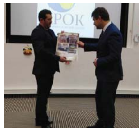
Тарас Костюк та Євген Перебийніс на відкритті «Кроку».

Керівник освітньої програми центру Марія Гаврилюк розповіла, що програми роботи центру будуть також розраховані і на батьків, які зможуть поглибити свої знання з англійської мови чи фінансової грамотності. На відкриття завітав і посол Євген Перебийніс.