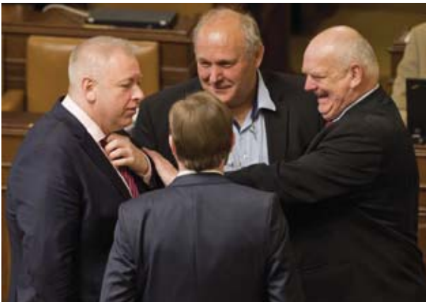
Міністр внутрішніх справ Мілан Хованец та депутат Вацлав Клучка готують у парламенті законний «зашквар» для іноземців.

Депутати чеського парламенту найближчим часом розглянуть поправки до Закону про перебування іноземців. Понад рік тому урядовий проект обговорювався з експертами і міністрами. Тепер свої зауваження подав соціал-демократичний депутат Вацлав Клучка. Поправки – у разі їхнього прийняття – найсильніше вплинуть на імміграційне право за останнє десятиліття, бо містять невинуваті обмеження для іноземців-членів сімей громадян Чеської Республіки, які походять з-за меж ЄС. Також пропонуються нові перешкоди для вже й так важкого доступу іноземних працівників на чеський ринок праці, є намагання скасувати демократичний контроль судів над рішеннями Міністерства Внутрішніх Справ.