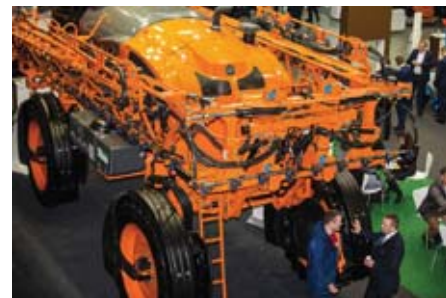
Міністри знайомляться з новітньою сільськогосподарською технікою, Київ, 15 лютого 2017.