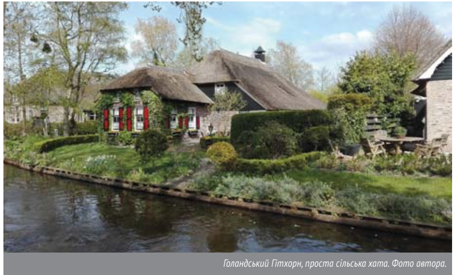
Голандський Гітхорн, проста сільська хата.

В Україні великі агрохолдинги заволоділи землею. Засипали гербіцидами довгострокової дії, і, крім ГМО-шних сої та кукурудзи, там нічого не росте. Але згадаймо: всю землю роздали колгоспникам, та вони її не взяли. Подекуди роками стояла неорана. Одиниці фермерством займаються. Всі з того села біжать, бо там нема