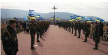
На Красному Полі під Хустом у березні щороку згадують полеглих за Карпатську Україну. Важливість армії тепер розуміється краще, ніж тоді...

Карпатська Україна 78 років тому проголосила незалежність, яка протрималася вкрай недовго. Кілька днів їй довелося оборонятися від наступу набагато сильнішої армії угорських фашистів. Тим подіям передували ще п'ять місяців повчальної розбудови держави у формі автономії, до якої край виявився неготовим, тому все відбувалося методом проб і помилок.