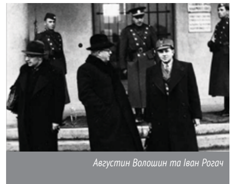
Августин Волошин та Іван Рогач