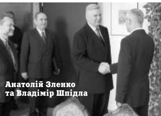
Анатолій Зленко та Владімір Шпідла

„Що стосується іншого стратегічного партнера України - Росії, то у відносинах з ним ми виробили оптимальну політичну дистанцію. Достатньо близьку, щоб підтримувати партнерський діалог. І достатньо віддалену, щоб не боятися буди втягнутими на орбіту цього геополітичного гіганта. Ідея про єдиний економічний простір з Росією, яка виникла у лютому, знаходиться в цій золотій середині. Як і головування України в СНД, пріоритетом якого будуть економічні, а не політичні питання. Але я б не радив чекати продовження у вигляді інтеграції України в російсько-білоруський союз чи Євразійського Союзу. Такого продовження не буде.