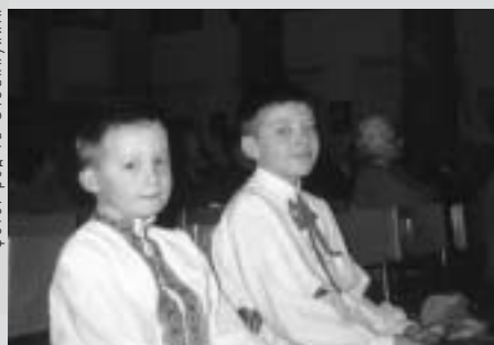
на акції зустрілись чотири генерації...