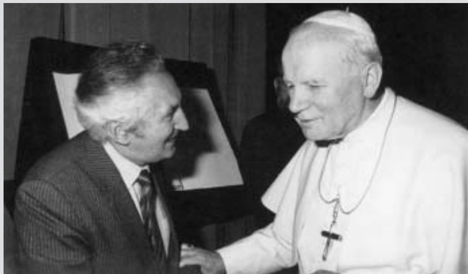
Аудієнція в Святійшого Отця. Рим, 1991 р.