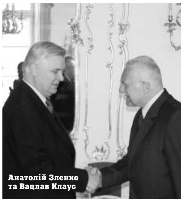
Анатолій Зленко та Вацлав Клаус

▲ В другий день свого візиту відбулася зустріч Міністра закордонних справ України А.Зленка з Президентом Чеської Республіки Вацлавом Клаусом. В ході бесіди сторони обговорили шляхи активізації політичного діалогу між двома державами на найвищому рівні. А.Зленко від імені Президента України Л.Кучми передав запрошення В.Клаусу відвідати Україну з офіційним візитом. Запрошення було з вдячністю прийняте.