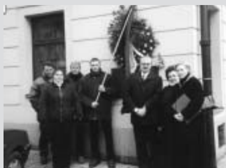
коло дошки, призначеної прешому нецензурованому виданні Кобзаря в Празі, Оплеталова вулиця