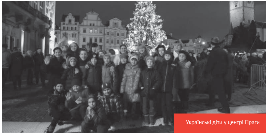
Українські діти у центрі Праги