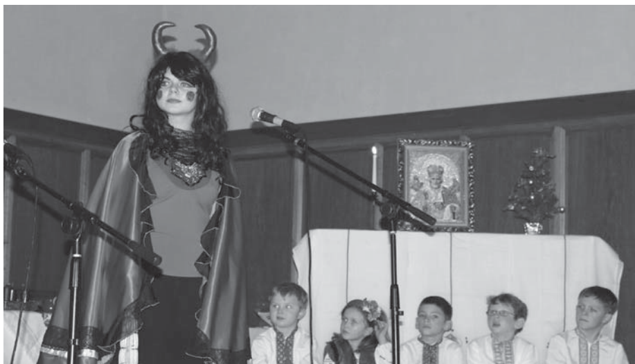
Під час виступу діток «Берегині» у Емаузах.