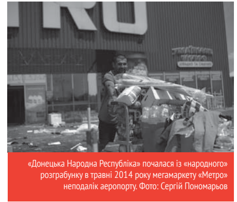
«Донецька Народна Республіка» почалася із «народного розграбунку в травні 2014 року мегамаркету «Метро» неподалік аеропорту.

З Ростовської області завозять молочні продукти, соняшникову олію, алкогольні напої, сигарети і бакалію. Мова йде, як правило, про товари нижчого цінового сегмента. При цьому, за даними Human Rights Watch, місцеві жителі скаржаться на дорожнечу російських продуктів. За останні півроку товари першої необхідності подорожчали в середньому на 50-60%; тоді як реальна середня зарплата в регіоні впала в три-чотири рази – сьогодні вона становить близько 2,5 тисяч рублів. Середня ціна літра молока в Донецьку – 40 рублів (до війни – близько восьми гривень), кілограм свинини – 360 рублів (до війни – 70 гривень), кілограм борошна – 70 рублів (до війни – 12 гривень).