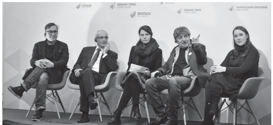
ТПід час презентації чеських театральних планів у Києві