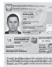
Приклад польської карти