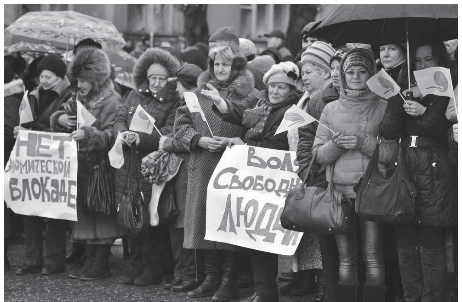
Деструкція мізків: учасники мітингу «проти блокади Донбасу» спочатку ходять на «референдум» проти України і «київської хунти», підтримують бандитів, а потім вимагають у тієї ж «хунти» пенсій та інших виплат...Фото з Луганська, грудень 2014 р.

Спори, особливо господарського характеру, вирішуються за участю «даху» з числа озброєних бригад. Сама наявність «даху» стала неодмінною умовою ведення комерційних справ. «Рішали» і лідери збройних груп («Восток», «Нацгвардія ДНР» – колишній «Оплот», «Прізрак», «Спарта» та інші)