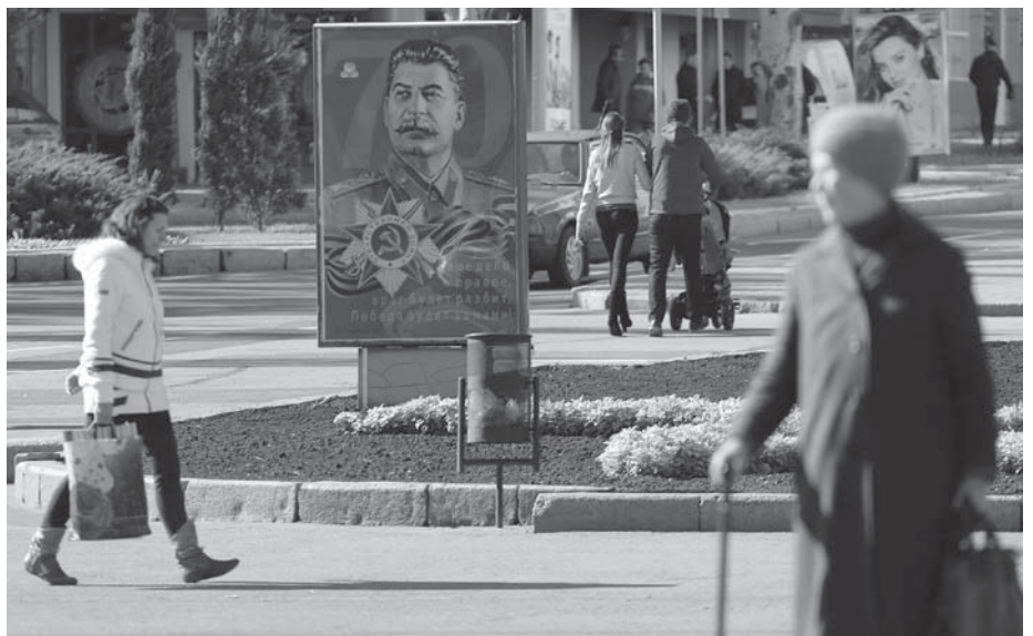
Сталінізм стає ледь не офіційною ідеологією у «ДНР». Фото із сьогодення Донецька (раніше Сталіно, Юзівка). Бандитський ватажок Захарченко неодноразово заявляв, що «шкодує про розвал СРСР».