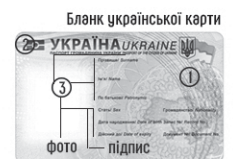
Бланк української карти

Єдиний державний портал адміністративних послуг (posluga.gov.ua)