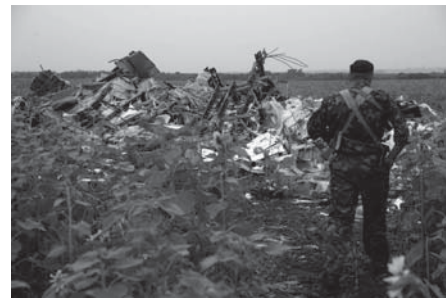
Бойовик «ДНР» стоїть біля рештків збитого російськими військовими цивільного малазійського літака.

Гігінс припустив, що військовослужбовці РФ перетнули український кордон і збили MH-17, і напевно діяли згідно з наказом. «Цей наказ повинен був пройти через різних людей. Звідки цей наказ виходив? Я думаю, що це має бути дуже високо. Повинні бути люди різних рангів, яким було відомо, що відбувається», - додав експерт.