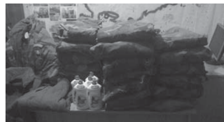
Доставлені українським солдатам чеські куртки.