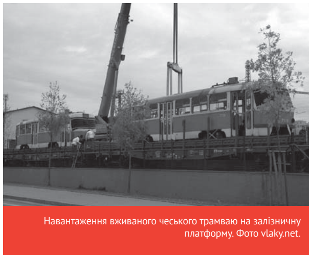
Навантаження вживаного чеського трамваю на залізничну платформу.

Прага раніше продавала невикористані трамваї Т3. Більшість попрямувала в Росію й Україну, в 2008 році навіть до північнокорейського Пхеньяну. Суми за