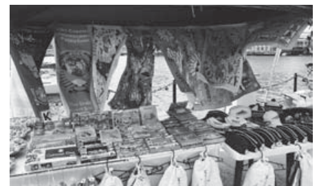
«Показ кузькіної матері»: ніяких народних традицій, тільки ностальгічно-радянські та військові сувеніри.

Разом з тим, тут все по-домашньому, ніби в тюремно-табірному дитинстві: не треба нічого вирішувати, бо «папик» прийде і дасть хуліганам коліном під зад. «Папика» звати Вова, його портрети – всюди. Чоловічок він, скажімо прямо, не особливо симпатичний, але кримчан це не бентежить: здається, що всі художники, які вчора малювали афіші для кінотеатрів, де Бреда Пітта не відрізниш від Халка, зараз малюють портрети Путіна на стінах, парканках і плакатах в маршрутках. Ось, наприклад, суворий Путін з двома кондиціонерами в руках. Намальований на стіні житлового