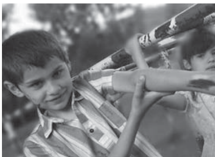
Тячівські діти – веселі, активні, патріотичні, але їм необхідна й моральна підтримка.

Щовечора аніматори зустрічалися з місцевою молоддю, яка приходила у дедалі більшій кількості. Деякі з радістю поміняли інтернет-дружбу на невідомий інтер-