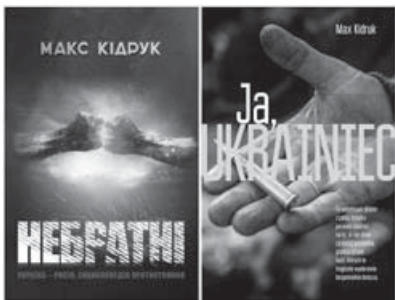
Обкладинки українського та польського видання книги Максима Кідрука.

Воювати за мир так само абсурдно, як прагнути возз'єднання народів, які ніколи не були єдиним цілим. Однак як це пояснити тим, хто засліплений загарбницькими ідеями, оглушений пропагандистськими потоками бруду та помиїв, роти котрих наглухо забиті кляпами «свободи слова»? Та чи варто пояснювати, якщо й сам не впевнений?