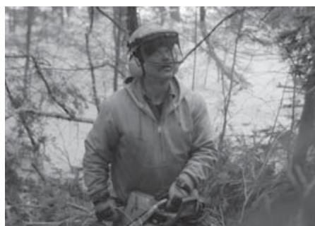
Кадр з фільму «Боб та дерева»

У Карлових Варах перемиг фільм, у якому головну роль зіграв Боб родом з України. Художній фільм американського режисера Дієго Онгара «Боб і дерева» здобув «Кришталевий глобус», головний приз 50-го міжнародного кінофестивалю у Карлових Варах, який закінчився 11 липня. Стрічка розповідає про життя лісоруба, який веде щоденний, часто нерівний бій заради своєї єдиної пристрасті – любові до природи.