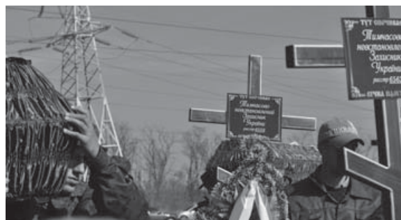
Похорони солдат на Дніпропетровщині.

30 липня на Краснопільському кладовищі в Дніпропетровську поховали 16 невідомих військових із зони АТО, які загинули в боях під Дебальцевим, Донецьким аеропортом, Старобешевим і Опитним. Всього тут поховали вже 225 невідомих військових. Перед цим у всіх загиблих військовослужбовців відібрали зразки ДНК. З 225 похованих бійців встановлено