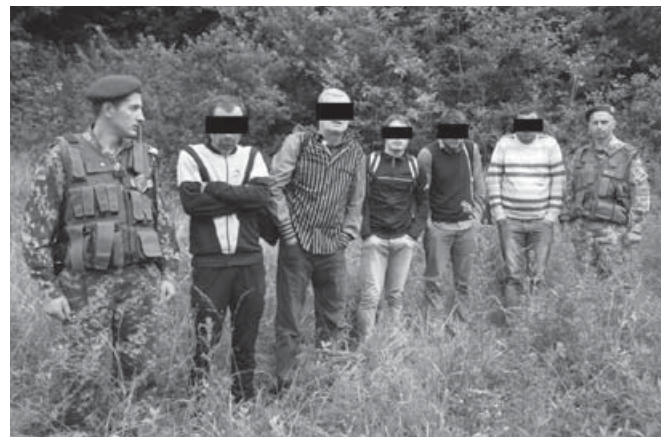
Затримання осіб без документів при спробі незаконного переходу державного кордону, Закарпаття, 2015 рік.

У лютому Всесвітня продовольча програма (WFP) розширила допомогу жителям Східної України, які постраждали в результаті бойових дій. Агентство ООН передало продовольчі пайки і купони на продукти майже 190 тисяч людей, які були змушені тікати з рідних місць або не можуть покинути прифронтову смугу. На початку липня делегації Програми розвитку ООН (ПРООН) та Представництва Європейського Союзу в Україні пообіцяли сприяти у вирішенні питання оптимальної організації пропускового режиму в зону АТО. Програма спрямована на допомогу переселенцям і надання їм психологічної підтримки. Також, за їхніми словами, багато уваги приділяється допомозі у знешкодженні замінованих територій.