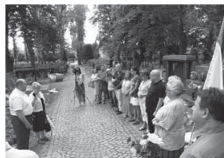
На Ольшанський цвинтар у Празі завітала громада, журналісти і посол – вшанувати поета, обговорити актуальне.