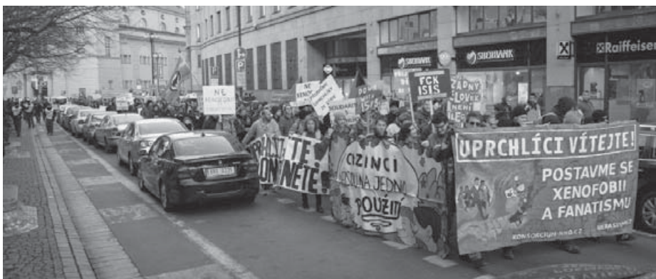
Одна із демонстрацій у Празі на підтримку прав іноземців.

Чеські громадські організації вирішили активніше боротися за права біженців. Консорціум організацій, які працюють з мігрантами, вважає, що утікачі, які мають на це право, повинні отримувати дозволи на в'їзд до безпечної Європи на законних підставах, і звертатися тут по захист. Людям, життя і здоров'я яких перебувають у небезпеці, має бути доступна, наприклад, гуманітарна віза або можливість возз'єднання родини.