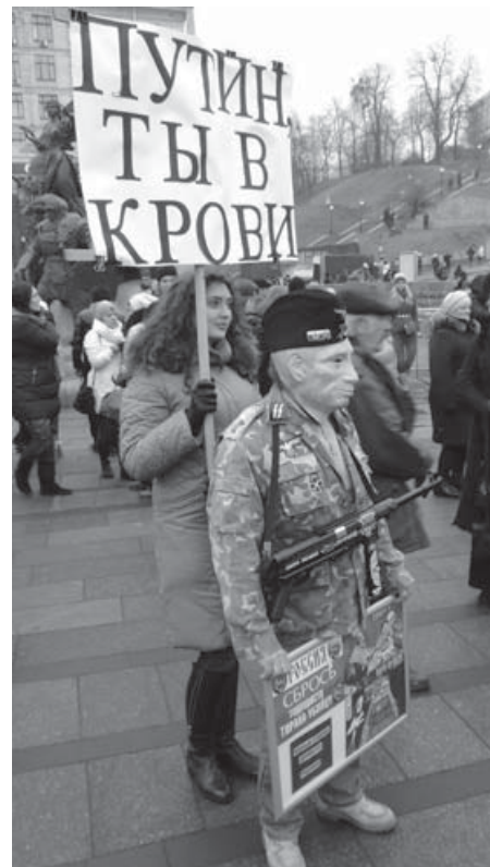
Київський майдан Путіна «не переварює»

Значне число мігрантів зрештою залишитися на тій території, якої вони хотіли найбільш уникнути – в Центральній Європі, тому що західні кордони щільно закриваються. Прийдуть нервозність, страх, сварки і бійки. І ми вже будемо недалеко від мети. Тролі почнуть писати, що частина населення хоче військову допомогу в захисті кордонів. Врешті решт, слов'янський брат ближчий, ніж чорний мусульманин.