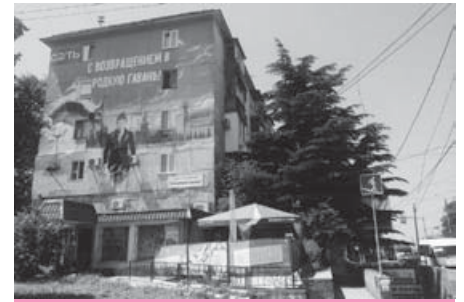
«Вежливий зельоний человек» несе до Криму два непрацюючі кондиціонери.

У Криму з'явиться майбутнє, якщо сюди хлине молода кров. Але так як здавна до Криму їздили самі лише хіпі, щоб лежати під деревом і курити бамбук, то тут сьогодні панує старість, яка замість молодих зробила вибір залишитися в Радянському Союзі. Це страшенно зручно: не треба туалети прибирати, можна просиджувати сидницю на роботі, чекати туристів раз на рік, а потім зимувати на ці гроші, і знову нічого не робити. Місцеві кажуть, що одне в Криму погано: наркоманів забагато. У кримських лісах можна зустріти галявини, де всі дерева втикані густим рядом використаних шприців.