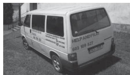
Нова південночеська проукраїнська організація відповідно позначила вже свою автівку.