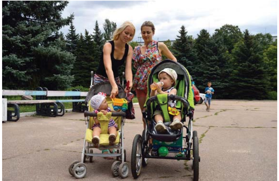
Світлодарські мами чеської допомоги у вигляді пелюшок були дуже раді.

Чехи допомагають на сході України від серпня минулого року, мають координаційний офіс у Києві, а допомогу організує з бази у Слов'янську. Нужденним надає термінову гуманітарну допомогу – продукти харчування, житло і медикаменти. Допомагає відновити пошкоджені будинки або умеблювати центри для біженців. Людям пропонує ваучери на купівлю про-