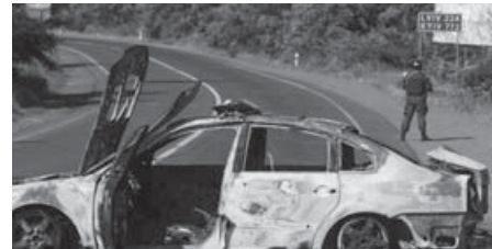
Згоріла міліцейська машина на місці інциденту на трасі поблизу Мукачева

Прокуратура Закарпаття розслідує перестрілку в Мукачеві як теракт. Генпрокурор Шокін передав кримінальне провадження, порушене прокуратурою Закарпатської області, Головному слідчому управлінню ГПУ. Також була створена тимчасова слідча комісія щодо розслідування подій у Мукачеві. Служба безпеки України провела 40 обшуків у представників обох сторін конфлікту в Мукачеві Закарпатської області. Було змінено очільників обласної міліції, митниці та самої області, тут запроваджують нову поліцію й посилюють боротьбу з контрабандою. Навколишні країни також посилили охорону своїх кордонів. Інцидент позначився на репутації краю: турбази, готелі й санаторії зазнали серйозних збитків через масове раптове скасування