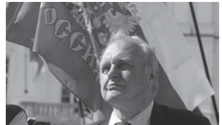
Чеський євродепутат-комуніст Мірослав Рансдорф ніяк не соромиться своєї українофобії: розповідав брехні про «оточених у Дебальцєві 2200 солдат НАТО», про свої особисті контакти із «керівництвом ДНР та ЛНР», нещодавно відвідав демонстративно окупований Крим.

В Україні виникла аналогічна установа – Інститут національної пам'яті – ще раніше, ніж у Чехії. І вимога розслідувань злочинів минулого тут була дещо гучнішою, ніж в Чеській