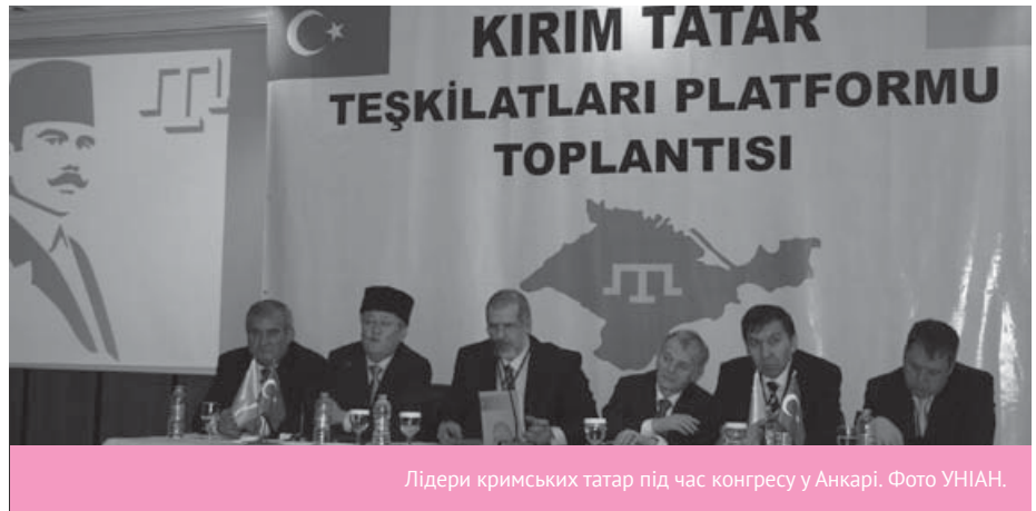
Лідери кримських татар під час конгресу у Анкарі.

Багато хто досі не розуміє, навіщо це Києву «загравати» перед кримськими татарами, адже вони – меншість у Криму. Треба знайти «дорогу до серця» російськомовної більшості – і Крим повернеться сам собою. Це – помилка. Російськомовній більшості населення Криму доля півострова байдужа, як і більшості населення Росії байдужа доля цієї країни. Різниця в тому, що відповідати