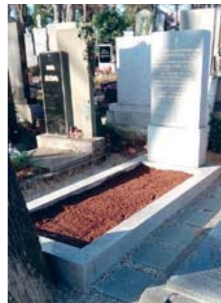
Відновлена могила Горбачевського на кладовищі в празькій Шарці