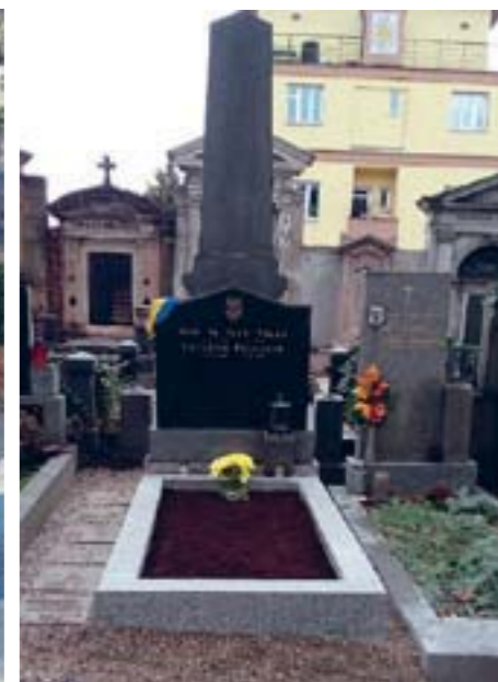
Відновлена могила Пулюя на кладовищі в празьких Мальвазінках

Могили вчених Івана Пулюя та Івана Горбачевського наведено в належний стан завдяки фінансовій підтримці Посольства та МЗС України. Могили адоптувала Українська Ініціатива в ЧР, допомогу у ремонті надала Міжнародна асоціація українців «Євромайдан».