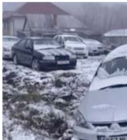
Напівпокинуті автомобілі українців на іноземних номерах у прикордонному селі Вубля в Словаччині.

Сплата всіх податків для отримання авто української реєстрації виливається не в одну тисячу доларів: митний збір – 10% вартості авто, ПДВ – 20%, акцизний збір – залежно від потужності двигуна. Відтак, куплене у Європі за 4 тисячі євро вживане авто після українського розмитнення додає у вартості до ще 2 тисячі євро. Тому водії таких авто використовували «сірі схеми» і користувалися послугами «литовських» чи «словацьких» фірм-прокладок. Власники авто з українськими номерами були незадоволені діями «євробляхерів», а також їх поведінкою на дорогах. На розгляді Верховної Ради вже було кілька законопроектів щодо врегулювання цієї ситуації. Влітку 2016 року були поступки – певне зниження мита на ввезення вживаних автомобілів. 8 листопада був прийнятий законопроект №8487 Ніни Южаніної, яким збори значно зменшуються. Однак резидент може в'їхати на митну територію України тільки у випадку сплати застави або їх повної сплати. Виняток – лише для