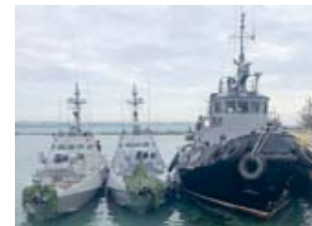
Захоплені окупантами судна українських ВМС «Бердянськ», «Нікополь» та «Яни Капу» в місті Керч на сході анексованого півострова Крим.

Росія посилює Азовську кризу саме зараз не просто так: нещодавній напад росіян на українські кораблі в Керченській протоці Кремль задумав тоді, коли Європу розривають власні проблеми з міграцією, «брекзітом», протестами «жовтих жилетів» тощо, а в Україні йде підготовка до виборів. Путін після Азова може піти й на блокаду Одеси, хоча там заблокувати судноплавство складніше через сусідство з країнами НАТО. Тим часом Росія продовжує затримувати торгові судна, які прямують в Азовське море: судна зупиняють, оглядають, ставлять у чергу. На прохід анексованою протокою можуть чекати сотні кораблів з обох боків. В результаті судовласники підняли вартість фрахту до $7 на тонні. Наприклад, з Маріуполя в порти Італії фрахт коштував $21, тепер – $28. Для порівняння, вартість фрахту з портів Чорного моря становить $15. Вантажі відправляють в порти Чорного моря. Але на це потрібен час, адже суднова партія накопичується 2-3 тижні. Крім того, автоперевізники не хочуть їздити за вантажами через зношені дороги в регіоні, а залізничне сполучення вкрай перевантажене.