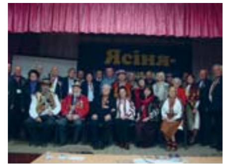
Частина учасників конференції.

Однак, поряд із важливим досягненням у сфері дослідження цих подій Української національної революції на Закарпатті сторічної давнини, існують певні проблеми що потребують подальшого вирішення, тому учасники конференції запропонували прийняти таку підсумкову ухвалу міжнародного наукового форуму: громадськості, представникам влади, краєзнавцям зреалізувати вирішення питання щодо перенесення тлінних останків загиблих воїнів Гуцульської народної оборони та Української Галицької армії, які загинули у січні 1919 протягом Сигітської військової операції і покаяться на території Румунії в місті Сигет та його околицях, до смт. Ясіня Рахівського району Закарпатської області – столиці тогочасної Гуцульської республіки; громадськості та представникам влади на Закарпатті 2019 рік оголосити роком президента Гуцульської республіки Степана Клочурака. Науковій громадськості, краєзнавцям, представникам влади підготувати до Міністерства освіти і науки України звернення щодо внесення у навчальні програми загальноосвітніх навчальних закладів: з історії України – уроку-пам'яті (у січні) про вшанування Гуцульської республіки; з української літератури – вивчення, як обов'язкового