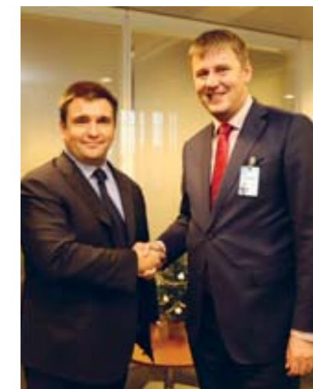
Павло Клімкін та Томаш Петржічек

технічна категорія, що говорить про заробітну плату дипломатів в даній державі, а не про політичний сигнал для двосторонніх відносин», — стверджують у відомстві. Термін виник у 2005 році, і спочатку використовувався у 8-ми, потім 10-ти і зрештою у 17-ти країнах. У зв'язку з тим, що він вводить в оману, то його планується змінити або скасувати. Окрім України, із списку були видалені диппредставництва в Угорщині, Туреччині та Італії. МЗС ЧР пояснює такий крок необхідністю створення посольства у африканській державі Малі. Про важливість відносин із Києвом свідчить і запланований на лютий 2019 року візит голови МЗС Чехії Томаша Петржічка в Україну. Про це заявив міністр закордонних справ України Павло Клімкін, який зустрівся із Петржічком у Брюсселі під час зустрічі дипломатів країн НАТО. Клімкін каже, що дипломат побачить «що і як робить Росія на Донбасі, не обійдемо увагою й інші ключові теми». Томаша Петржічка призначили міністром закордонних справ Чехії у жовтні 2018 року. До цього він був помічником євродепутата Мирослава Похе, з 2014 року працював в Європей-