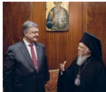
Президент Петро Порошенко та Вселенський Патріарх Варфоломій.

Та відомо лише імена двох священнослужителів УПЦ МП, участь яких у Соборі є можливою, – це митрополит Симеон і митрополит Софроній. УПЦ МП у відповідь подала три позови до Верховного суду України. Окрім російських церковників, автокефалії активно протистоїть олігарх Вадим Новинський, росіянин, якому громадянство України надав президент-утікач Віктор Янукович лише 8 років тому. Його називають спонсором УПЦ МП і всієї кампанії проти Томосу.