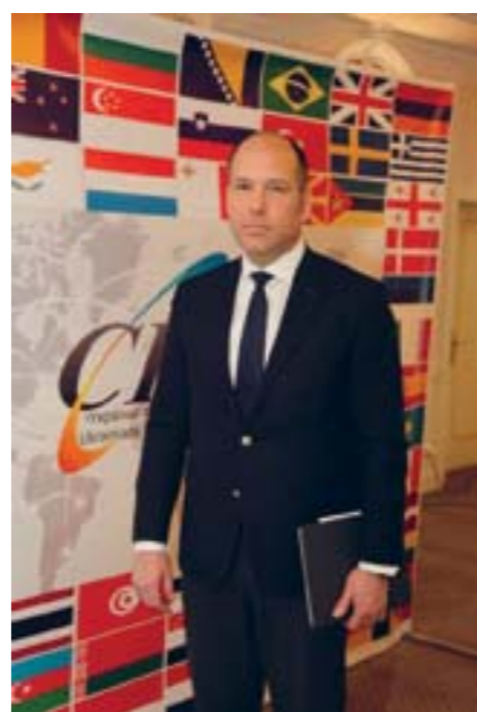
Павло Грод – новий Президент СКУ.

Під час своєї промови на брифінгу Павло Грод озвучив своє бачення ролі діаспори в житті України та основні засади діяльності новообраної управи СКУ: Світове українство є однією з найпотужніших діаспор у світі та здатне відстоювати важливі для України питання на найвищому рівні завдяки добре координованій діяльності; Діаспора повинна мати міцні громади, які будуть моральним хребтом України та боротися за суверенітет української держави незалежно від складу українського уряду; Розбудова сильних інституцій має стати одним з пріоритетів СКУ. Відкриття українських шкіл, церков, мистецьких центрів, торговельних та професійних представництв дозволять не втратити мільйонів українців за кордоном через асиміляцію; Шістдесят мільйонів українців в світі сьогодні близькі як ніколи. Усвідомлення єдності, що не обмежена державними кордонами – основа сучасної української ідентичності; СКУ засуджує напад Росії на українські кораблі в Керченській