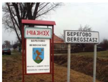
Напис на в'їзді до Берегова дублюється не лише угорською латинкою, але й староугорським рунічним письмом IX століття.

протести Будапешта. Невдоволені угорські діячі й новим українським законом про мову.