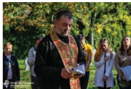
Брненські українці помолилися за спокій захисників України