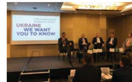
Володимир Омелян виступає на чесько-українському бізнес-форумі.