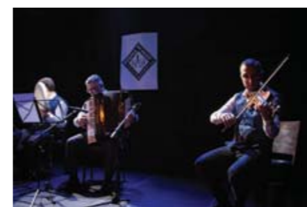
Грає гурт «Мусафір»

Кримськотатарський вечір відбувся 8 жовтня у столичному експериментальному центрі «NoD». Велика кількість глядачів могла послухати унікальну, хоча місяцями дуже сумну, панельну дискусію про сучасний стан прав людини в Криму. До Праги на цю подію завітав кримсько-