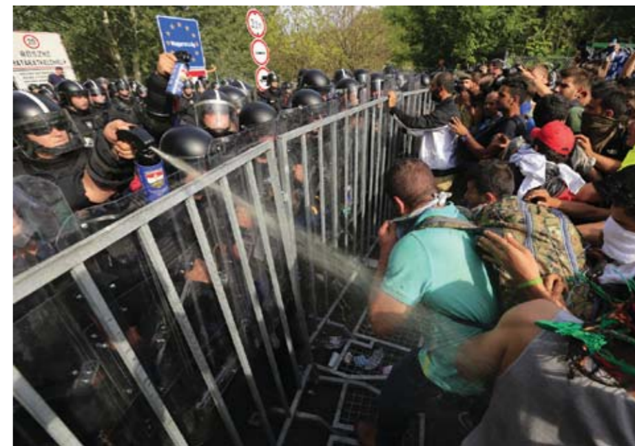
Прикордонне село Роске стало символом міграційної кризи. Жорсткі заходи угорської поліції допомогли Орбану зміцнити владу.

Депутат Європарламенту Маріо Борге-джіо від італійської партії «Ліга Півночі», відомий своїми проросійськими і антимігрантськими висловлюваннями, цілком підтримав Віктора Орбана: «Угорщина абсолютно права тому, що хоче припинити неконтрольований потік тисяч економічних мігрантів. Це – зовсім не ті, хто біжить від війни. Італія повністю солідарна з Угорщиною з цього питання». Угорці загалом підтримують правлячу партію «Фідес» – її рейтинг коливається від 33 до 45 відсотків, дії уряду Орбана підтримує 56% населення. До кінця цього року стане ясно, чи зважиться Брюссель застосувати санкції до Угорщини, або