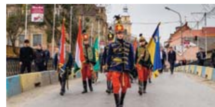
Угорська громада на Закарпатті проводить численні масові культурні заходи і всюди в краї намагається нагадувати про свою присутність.

В угорському питанні цим державам варто виступати єдиним фронтом і надавати інформаційну підтримку у випадку чергової дипломатичної чи