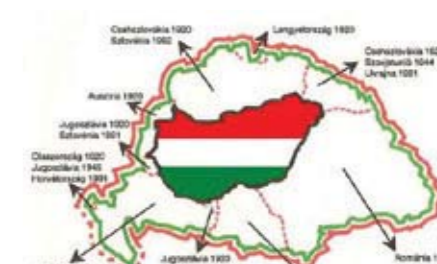
У 1920 році 72 відсотки колишньої Габсбурзької Угорщини відійшло до інших країн. «Тріанонська травма» дотепер болить багатьом угорцям, але через сто років ділитися кордони і переглядати результати Першої Світової через це ніхто не збирається.

можливих територіальних претензій. Якщо раніше про прагнення Будапешта отримати контроль над цією частиною України говорити вголос і гучно було не прийнято, то за останній рік керівництво Угорщини про це заявило кілька разів, на різних рівнях. «Вживання угорців, які проживають за кордоном, залежить від того, чи зможуть вони досягти успіху, рухаючись в напрямку досягнення автономії», – заявив віце-прем'єр Угорщини Жолт Шем'єн. Посол Угорщини в Україні Ерно Кешкенй також казав, що «в автономії нічого поганого немає», бо «в Європейському Союзі дуже багато практичних прикладів». Але ж Україну Будапешт в ЄС поки що бачити не хоче, та й останні події в іспанській Каталонії не є гідні привабливим прикладом. А ще Кешкенй нагадав, що в грудні 1991 року, коли проходило голосування про незалежність України, одночасно пройшло голосування про автономію Закарпаття і автономії Берегівського району. «Тоді ж 78% жителів Закарпаття підтримали автономію для області, а 82% – для Берегівського району», – заявив посол.