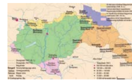
Угорське королівство у 1920-1944 роках. Напередодні та під час Другої Світової воно захопило території ЧСР, Румунії та Югославії. І ревізіоністів влаштували б і такі кордони.

У зв'язку з цим виникає закономірне питання: навіщо угорській владі в Будапешті так витратитися на український регіон? Правлячій партії Орбана підтримка угорської діаспори приносить популярність в очах населення Закарпаття та патріотичної частини самої Угорщини, що виражається у додаткових мандатах для «Фідесу» від закордонних угорців. Будапешт також намагається запобігти від'їзду угорців – закарпатці з угорськими паспортами масово емігрують не в саму Угорщину, а до багатьох країн Європи на навчання або роботу. А скорочення кількості етнічних угорців ставить під сумнів подальше обґрунтування