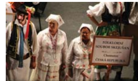
«Скеюшан» із Хомутова