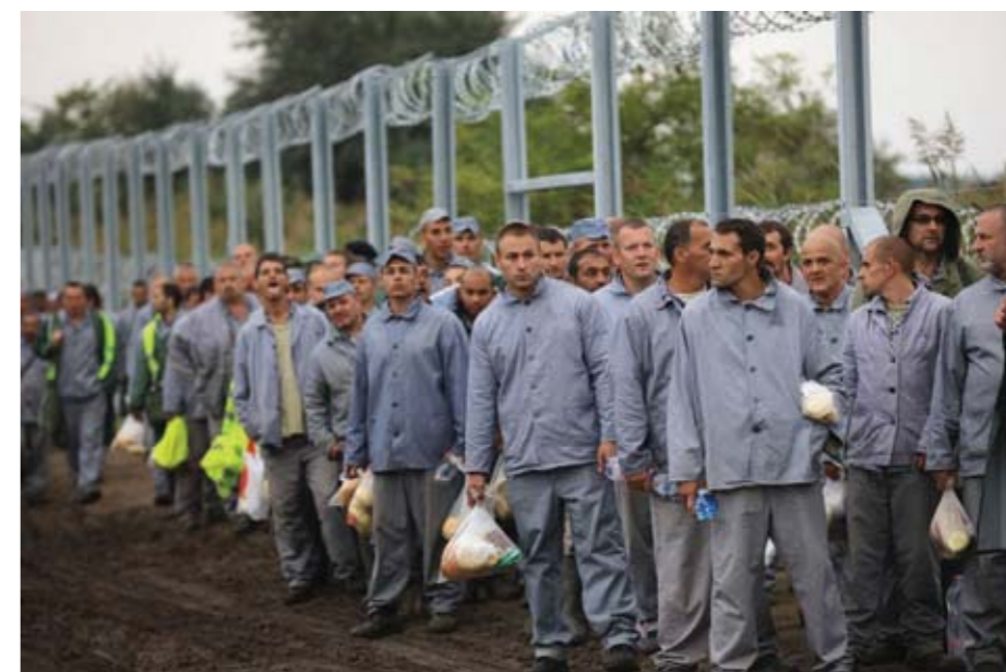
Угорські в'язні готуються до будівництва «стіни» на кордоні Сербії та Угорщини, 2015 рік.

Будапешт підтримала також Італія, одна із країн-засновників ЄС. Навесні цього року тут до влади прийшли євроскептики і популісти. «Європарламент не може владотворити процеси проти народів і обраних цим народом урядів», – заявив заступник голови італійського уряду Маттео Сальвіні.