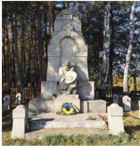
Пам'ятник у Лада в Под'ештеді.

На Свято святої Покрови та до Дня захисників Вітчизни українці Чехії вирушили в поїздку місцями української пам'яті, організовану Посольством України в співпраці з фірмою-перевізником «Regabus». Учасники відвідали 4 пам'ятники воїнам Української Галицької Армії, що боролися за українську свободу та незалежність. Ці пам'ятники – роботи відомих українських скульпторів – розташовані у різних куточках Чехії: Ліберець, Лада в Под'ештеді, Йозефов та Пардубіце. Посол України Євген Перебийніс у своєму вітальному слові висловив побажання, щоб така поїздка стала хорошою традицією для чеських українців. Посольство України останнім часом активно займається реконструкцією пам'ятних місць у Чехії. Три з чотирьох пам'ятників даної поїздки було реконструйовано за кошти МЗС України.