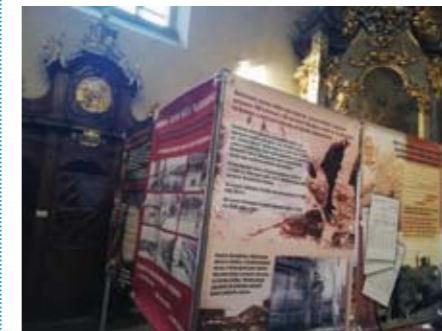
Виставка про Голодомор у ліберецькому храмі.