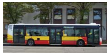
П'ять градецьких автобусів поїдуть до закарпатського Тячева.