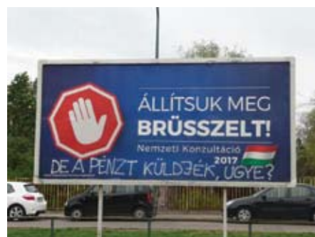
Баннер перед референдумом про міграційні квоти в Угорщині закликає «зупинити Брюссель». Та все ж чимало угорців заклики «Фідесу» сприймають скептично (вручну дописано – «Але гроші від нього маєте, правда?»)

Відносини між Брюсселем та Будапештом вкрай загострилися понад три роки тому. У 2015 році країна побудувала 155-кілометровий паркан на кордоні із Сербією – проти навали біженців. Прем'єр-міністра Угорщини Віктора Орбана звинувачують у надмірній жорсткості. А він називає міграційну політику ЄС «загрозою християнській ідентичності» і «троянським конем тероризму». Непоступливість Угорщини була підтримана Польщею, а потім і Австрією та Італією. Лідер британських євроскептиків Найджел Фарадж навіть жартівливо закликав Угорщину «вступити в клуб Brexit».