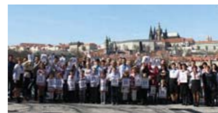
Фото з минулорічної акції.

Українська громада готується до традиційного проведення Дня Вишиванки у чеській столиці. Товариство Українців в Чехії «Берегиня» запрошує всіх шанувальників народного українського одягу до масштабних святкувань 17-20 травня цього року. «Невід'ємною частиною свята є вишиванкова хода центром міста. Гаслом мегамаршу буде «Одягни вишиванку і приєднуйся до нас!».