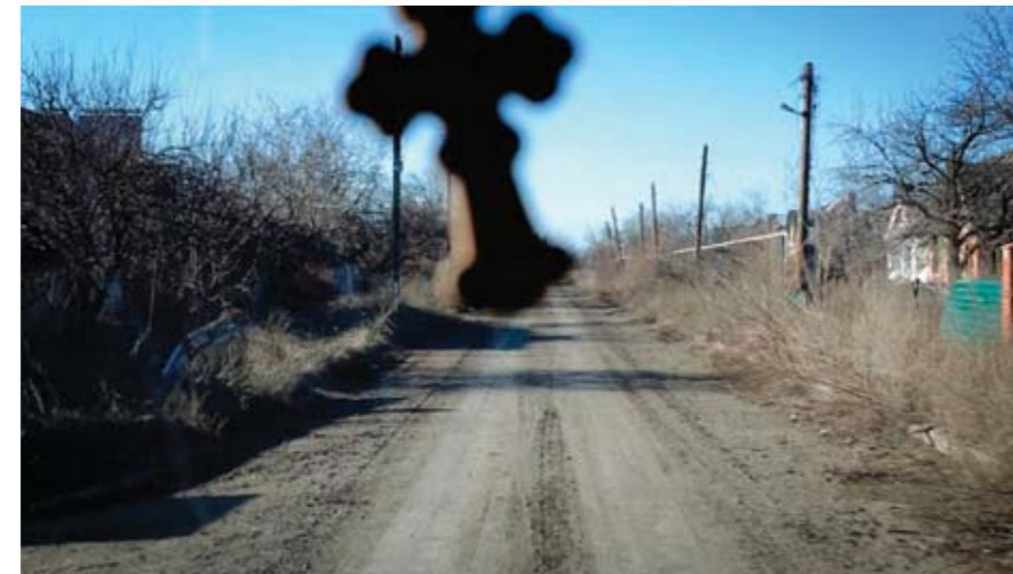
Кадр Юрая Мравця із фільму «Мир з вами».

На відомому празькому кінофестивалі з прав людини «Один світ» було продемонстровано цього року лише дві картини, які стосувалися. І обидві – виробництва інших країн, зокрема Словаччини та Данії. Минулого року ця тема була щонайменше у два рази більшою, багато говорилося про Крим. Цього разу йшлося здебільшого про Донбас. Перший фільм 30-річного словацького режисера та фотографа Юрая Мравця «Мир з вами» (2016). Картина намагається описати конфлікт з обох сторін. Режисер спочатку побував на проросійському боці фронту у квітні 2015 року. Але у лютому наступного року бойовики заборонили йому в'їзд, Мравец знімав згодом у тій частині Донбасу, де