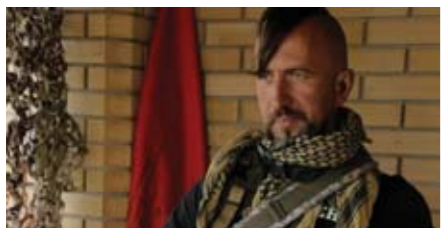
Василь Сліпак («Міф»).

Божої Чоти» Леоніда Кантера та Івана Яснія розповідає історію життя та загибелі Василя Сліпака – оперного співака зі світовим ім'ям та унікальним голосом, який поїхав захищати Україну від російських загарбників. У стрічці поєднано документальні кадри та анімацію, яку створив український карикатурист Юрій Журавель. Музику для фільму написали одні з кращих композиторів сучасності. Серед них – Євген Гальперін, що писав музику для Люка Бессона і був близьким другом Василя, Роман Григорів, Ілля Разумейко та Едуард «Діля» Приступа. Як повідомляють в «Українській Європейській Перспективі», яка